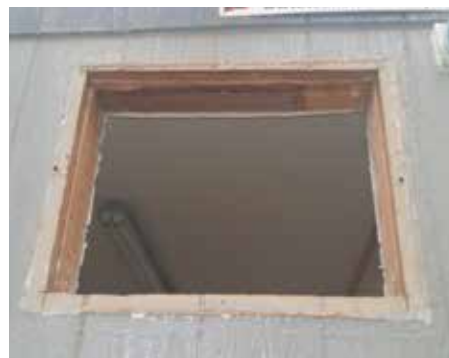
Fig. N° 1 Desinstalación de la tapa del vano