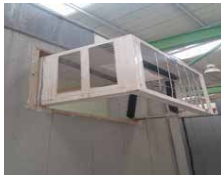
Fig. N° 2 Instalación de la carcasa del aire acondicionado