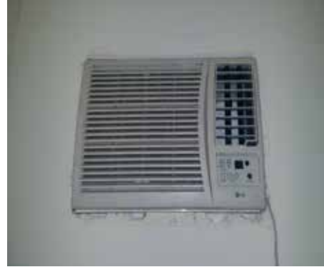
Fig. N° 3 Instalación de equipo