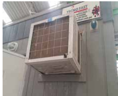
Fig. N° 4 Instalación de acabado interior y exterior